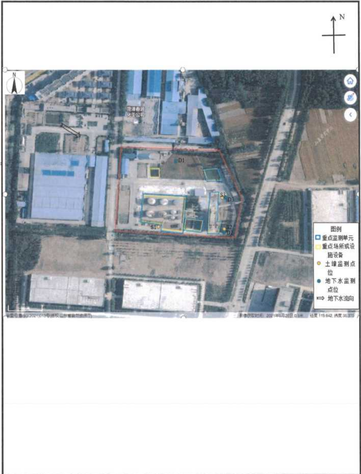
附图：厂界及布点示意图